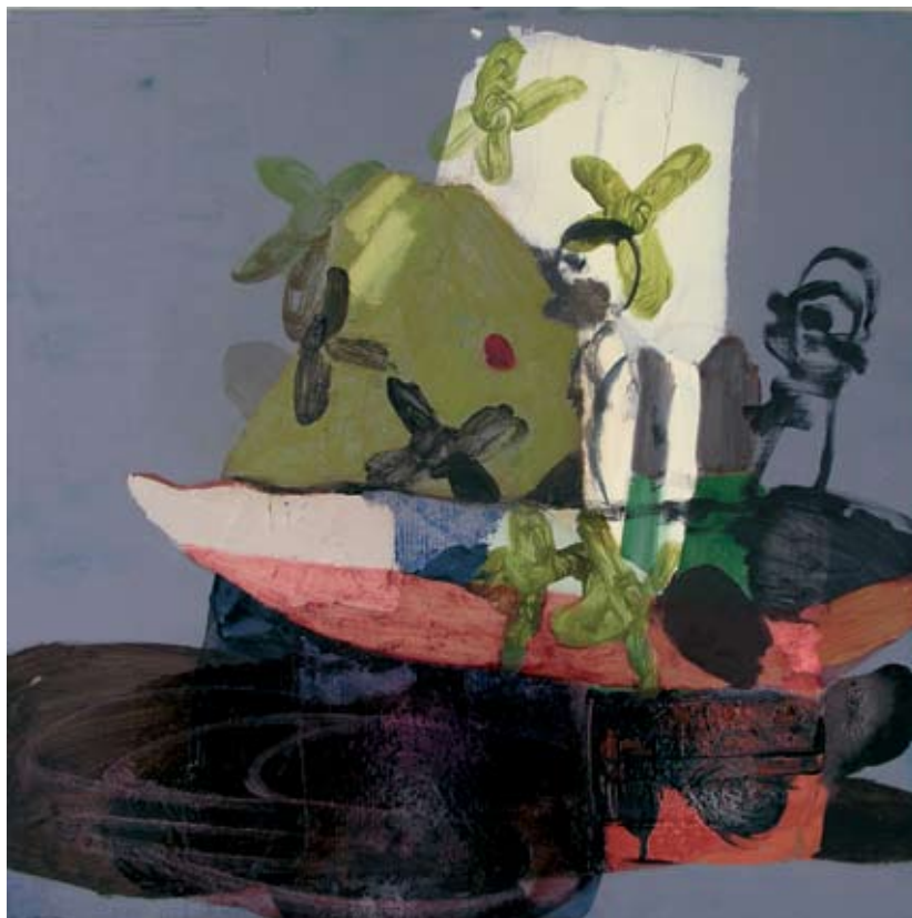
תקווה סגולה, 2008, שמן על עץ לבוד, 60×60 ס"מ Purple Hope, 2008, oil on plywood, 60×60 cm