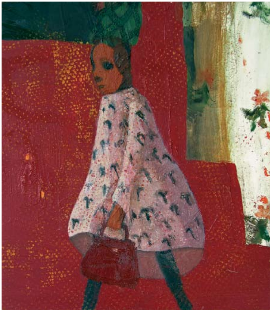
מוטב מאוחר II, 2008, שמן על עץ לבד, 40×35 ס"מ Better Late II, 2008, oil on plywood, 40×35 cm