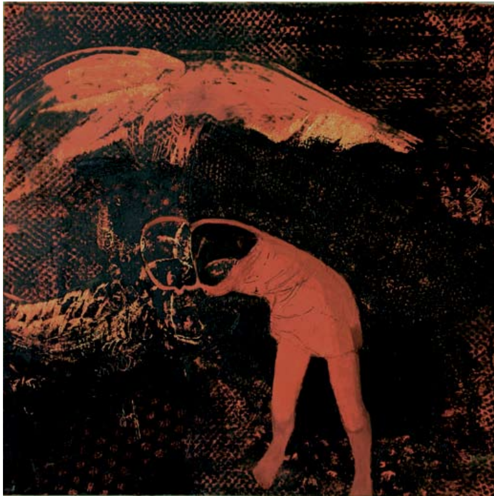
ללא כותרת (נוף געשי), 2008, שמן על בד ומוזניט, 50×50 ס"מ Untitled (volcanic landscape), 2008, oil on canvas and masonite, 50×50 cm