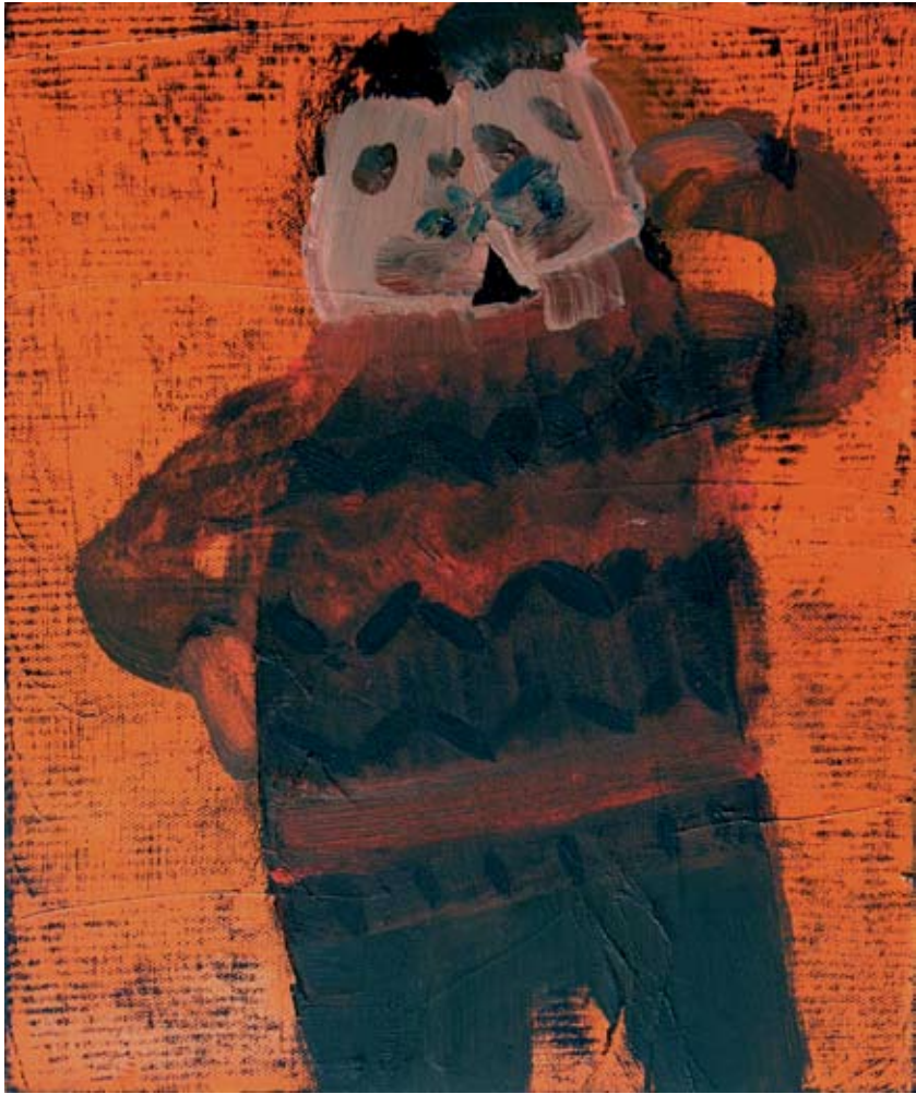
סוודר נהדר שלי, 2006, שמן על בד, 30×25 ס"מ My Lovely Sweater, 2006, oil on canvas, 30×25 cm