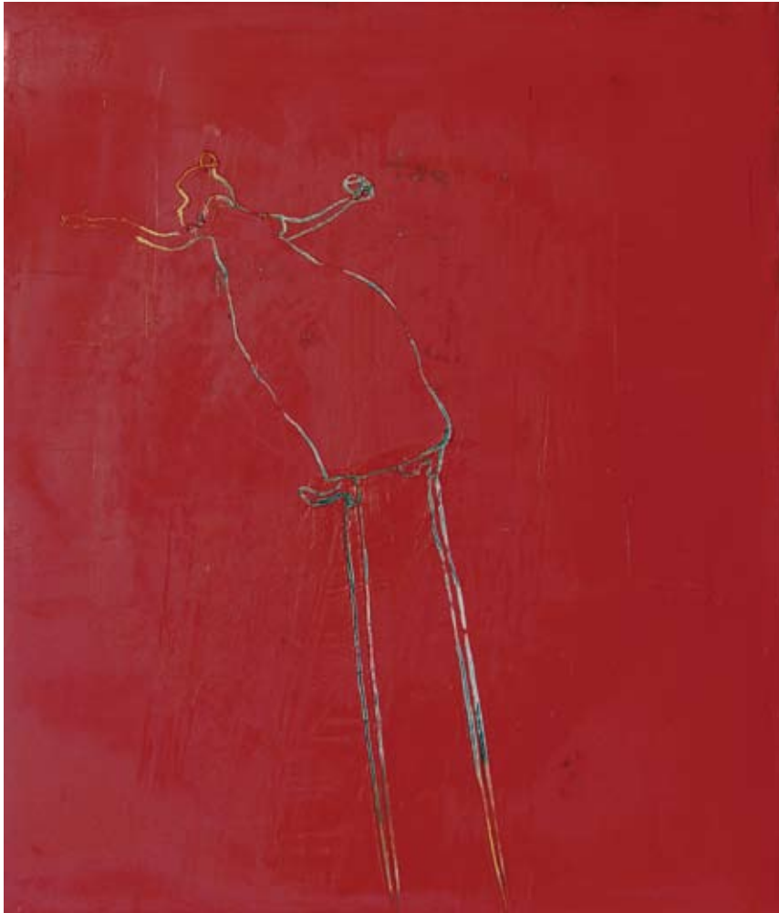
ללא כותרת, 2006, שמן ואבקת גבס על עץ לבד, 70×60 ס"מ (אוסף משפחת אתר) Untitled, 2006, oil and marble powder on plywood, 70×60 cm (Collection of Attar Family)