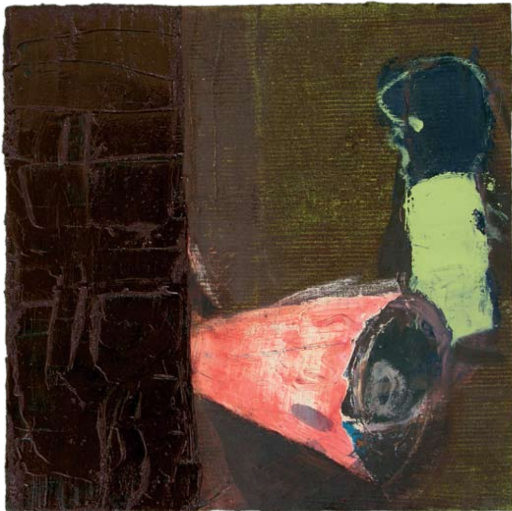
ללא כותרת (נואם מוסתר), 2008, שמן על בד ומזוניט, 35×40 ס"מ Untitled (Hidden Speaker), 2008, oil on canvas on masonite, 35×40 cm