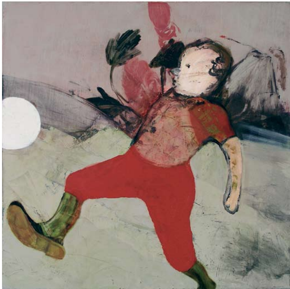
כדורגל פוגי, 2008, שמן על עץ לבוד, 60×60 ס"מ (אוסף פרטי) Fuji Football, 2008, oil on plywood, 60×60 cm (Private Collection)